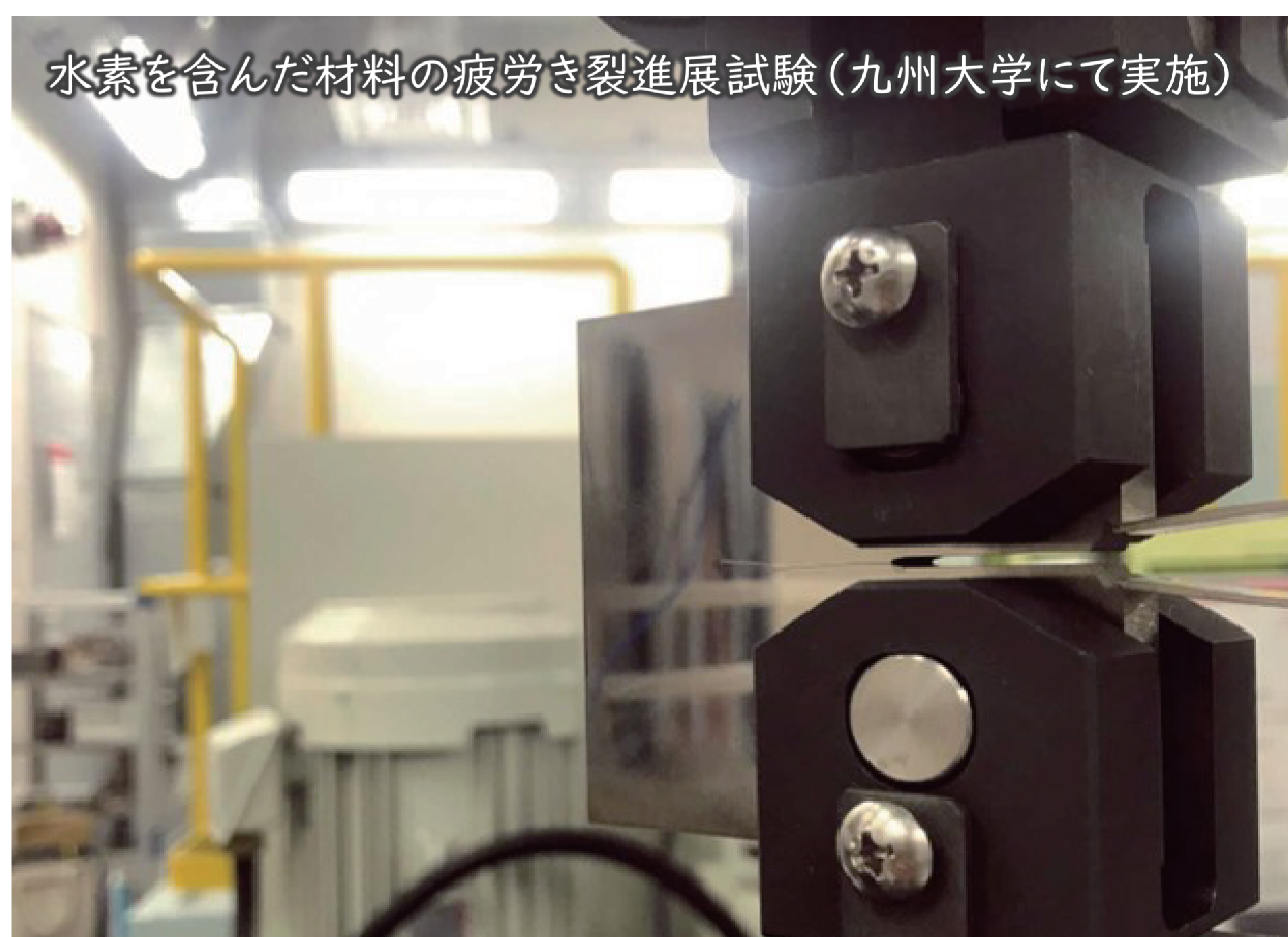
水素を含んだ材料の疲労き裂進展試験（九州大学にて実施）

最近では無料で使える高機能な 3D CAD・CAE ソフトが提供されていることもあり、これらを用いた設計が身近になりました。さらに、作成した3Dモデルから容易に製品を造形できる3Dプリンタの普及により、「ものづくり」をする上で専門的な知識や技能が必要なくなったように思われるかもしれませんが、しかし、実際には、製作した機械部品の破壊を防いだり、製品の品質を向上したりするために専門知識が必須であることは以前から変わっておらず、むしろ3Dプリンタに特有の加工上の制約やCAE・CAMの動作原理などを新たに学ぶ必要があります。本テーマでは、力学試験機の開発を通して、大学で学んだ知識を応用する力、CAD・CAE・CAMソフトを使用する技能、3Dプリンタを用いたものづくりの技能を習得することを目標とします。