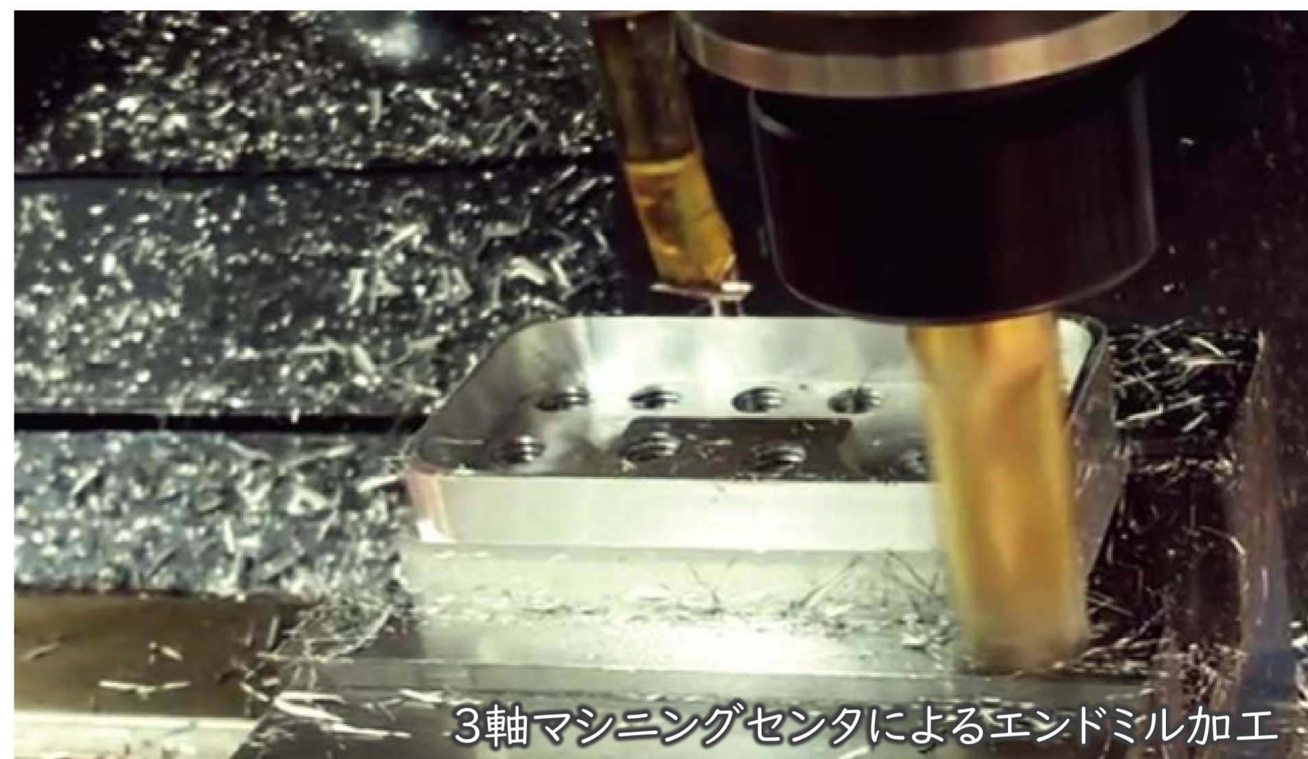
3軸マシニングセンタによるエンドミル加工